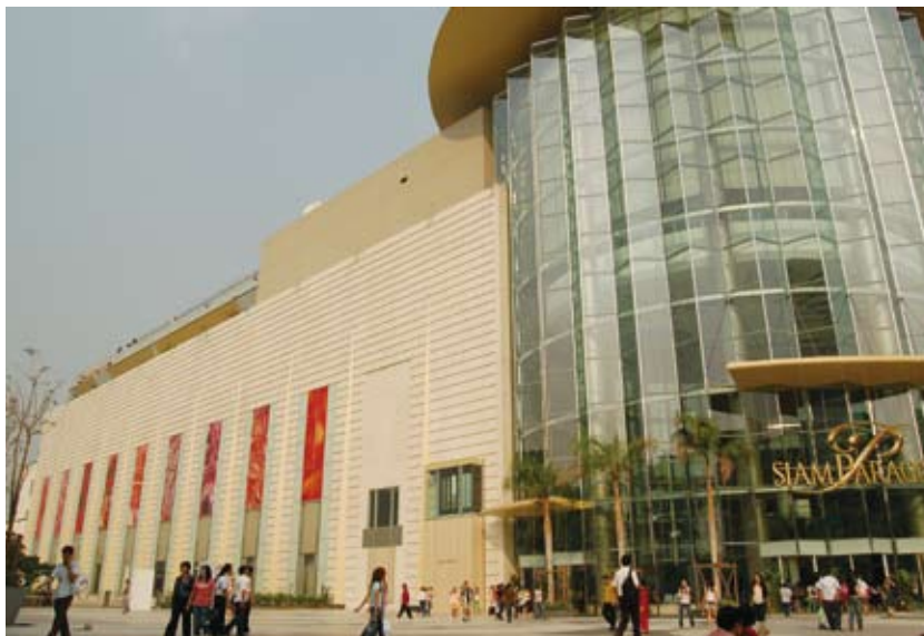
サイアムパラゴン